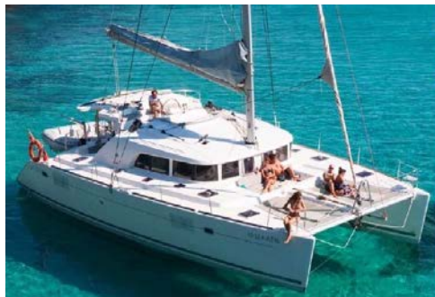
บลู นิคอบาร์ “Blue nicobar” Lagoon 440